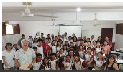
Ilustración 3. Fotografías