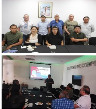
Ilustración 3. Fotografías

Finalmente, se presentan fotografías que evidencian las acciones aquí expuestas. Ver ilustración 3.