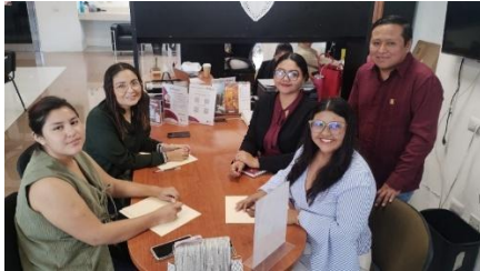
Ilustración 2. Evidencias de atenciones